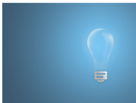
¿Qué es el Think Tank?