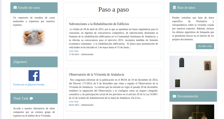
FIGURA : Página principal de PASOS (II).