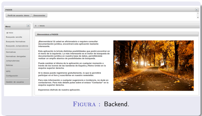
FIGURA : Backend.